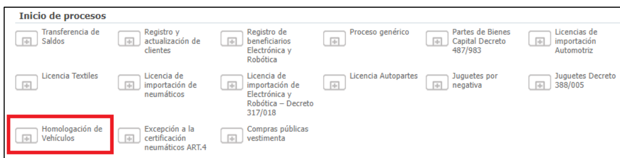
Figura 2 – Inicio del proceso de homologación.

Se debe iniciar un proceso de “Homologación de Vehículos” (ver Figura 2), logueándose con un usuario de persona física (no se podrá iniciar el trámite con usuario de persona jurídica).